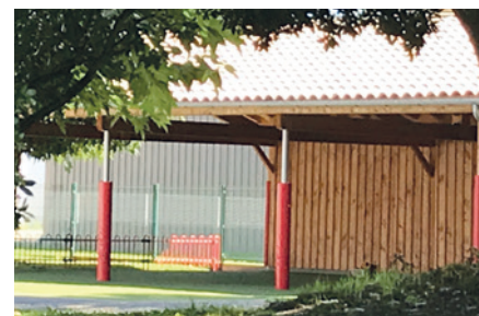
Entretien et amélioration des bâtiments scolaires