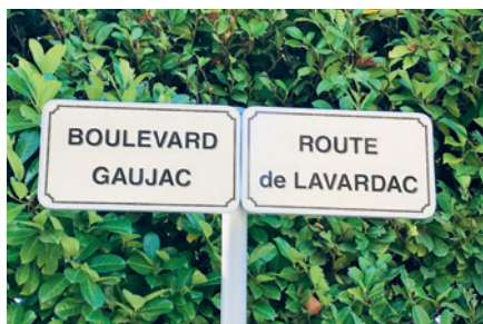
Mise en place de l'adressage normalisé

L'implantation de nouvelles toilettes publiques fait partie de l'étude de programmation urbaine qui a été lancée.