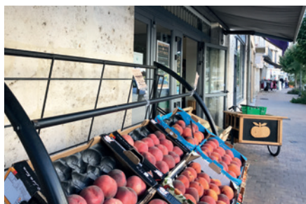
Accompagner les initiatives des commerçants du centre-ville

Travail conjoint avec Territoire d'Énergie 47.