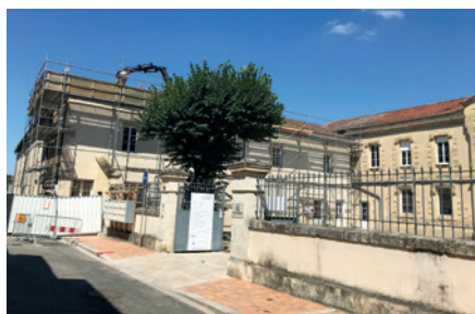
Travaux de rénovation du Centre Samazeuilh