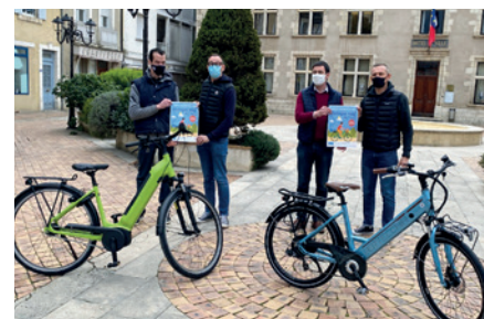
Mise en place de l'aide forfaitaire à l'achat d'un vélo électrique