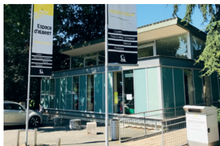
Gratuité de la médiathèque pour les -18 ans en 2022