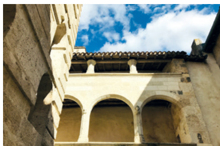
Animer la Maison des Conférences

En 2021 la piscine municipale a été fermée l'été au profit du Ludoparc en mutualisant le personnel.