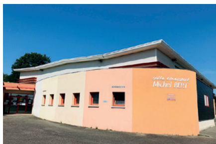
Travaux réguliers sur les équipements sportifs

L'été 2021 a été marqué par une fermeture inacceptable de l'antenne SMUR de Nérac durant 5 semaines malgré les diverses interventions des élus et les manifestations des habitants qui ont eu lieu.