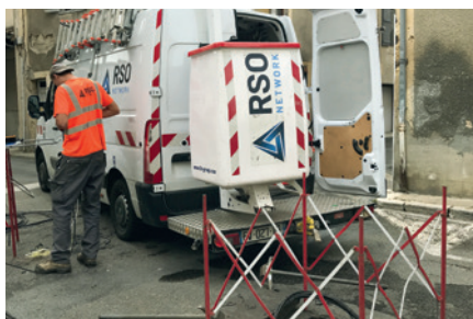
Déploiement de la fibre optique