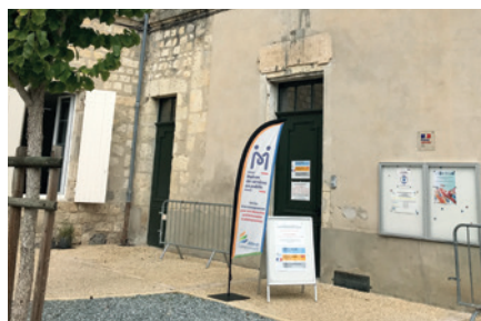
Maison France Services au Centre Haussmann