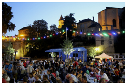
Marchés nocturnes "Mardis So Gascogne"