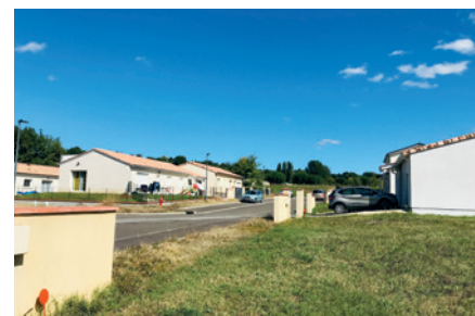
Le lotissement Plaisance