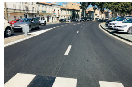
La chaussée des allées d'Albret rénovée