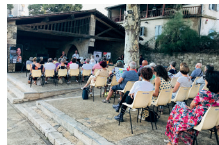
Présentation de la nouvelle saison culturelle