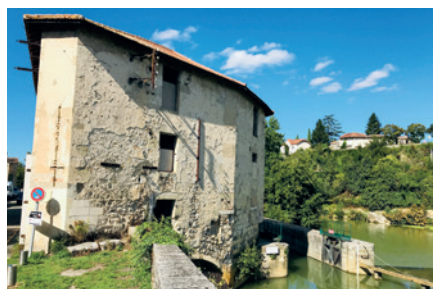
Relancer la production d'électricité du moulin du Pont-Vieux