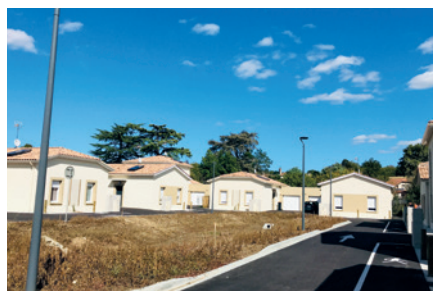
Les locataires installés dans la résidence Simone Veil