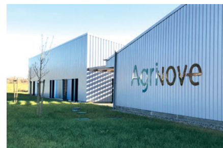
Poursuivre le développement d'Agrinove