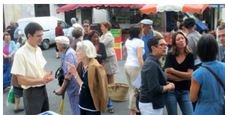
La permanence mensuelle des élus au marché (ici en 2008)