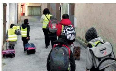
Le Car à pattes pour la sécurité de nos enfants