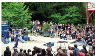
Le parc de la Garenne, objet de toutes les attentions