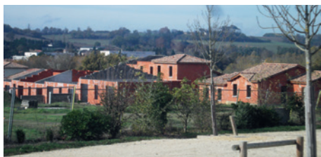
Les logements inachevés de Bourdilot repris par Habitayls