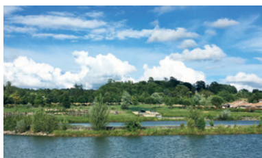
Se promener à Plaisance autour des bassins