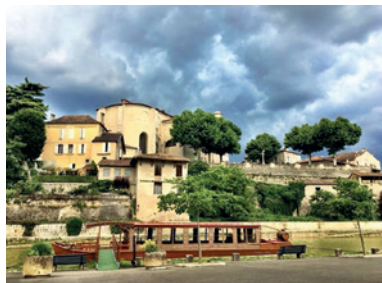
Le Prince Henry, pilier du tourisme à Nérac

2008 2009 2010 2011 2012 2013 2014 2015 2016 2017 2018