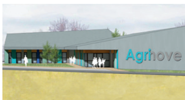
La pépinière d'entreprises : ouverture à l'été 2019