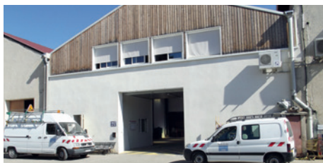
Les ateliers municipaux rénovés après l'incendie