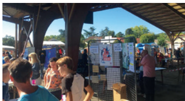
Le forum des associations début septembre