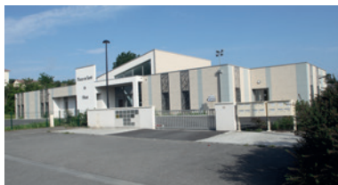
La maison de santé ouverte en 2017

2008 2009 2010 2011 2012 2013 2014 2015 2016 2017 2018