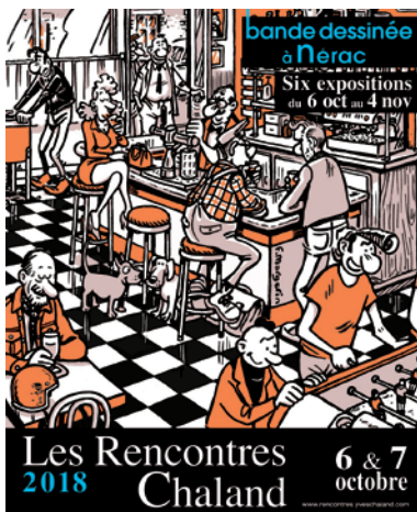
Les Rencontres Chaland depuis 2008 : BD à Nérac