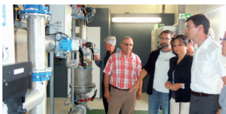
La station de filtration de l'eau de Guillery rénovée