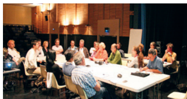
Réunion de concertation dans le cadre de l'Agenda 21