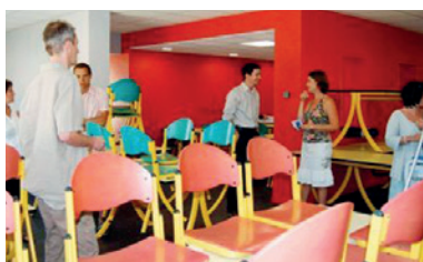
Dernière visite du self-service avant ouverture