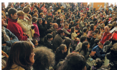
Les Néracais nombreux à l'ouverture de la première Garenne Partie en 2012