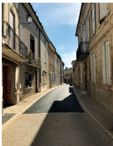
La rue Gambetta rénovée en 2018