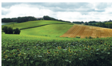
Une agriculture qui protège nos paysages