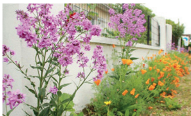
Le Zéro Phyto : imaginons nos trottoirs !