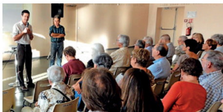
Réunion publique pour présenter le Secteur Sauvegardé