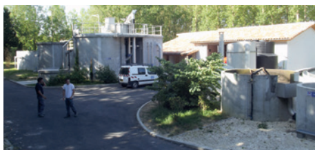
La station d'épuration reprise en régie pour plus d'économies et d'efficacité