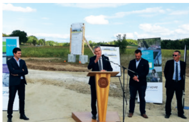
Agrinove : pose de la première pierre en septembre 2018