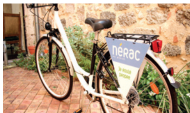
Les économies de carburant dans les services... grâce au vélo