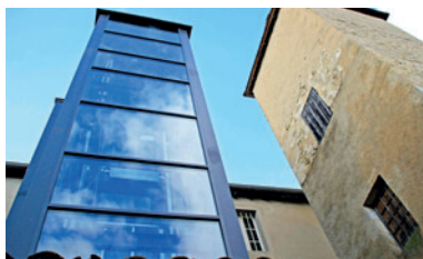
Ascenseur du centre Haussmann