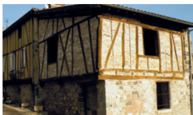
Le chantier école des Tanneries - L'insertion par le travail