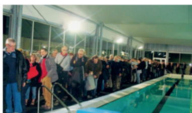
Les Néracais nombreux lors de l'inauguration de la piscine