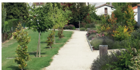
Création de la coulée verte au Couloumé