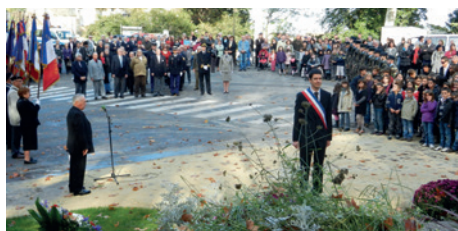
Le devoir de mémoire