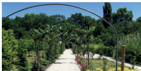
Le jardin Renaissance