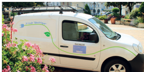
120 agents municipaux à votre service