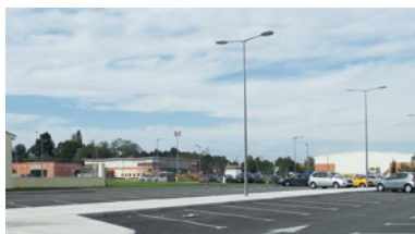
La zone de santé du Pin pour favoriser la présence médicale à Nérac, aujourd'hui remplie