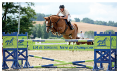
Soutien aux journées de l'élevage