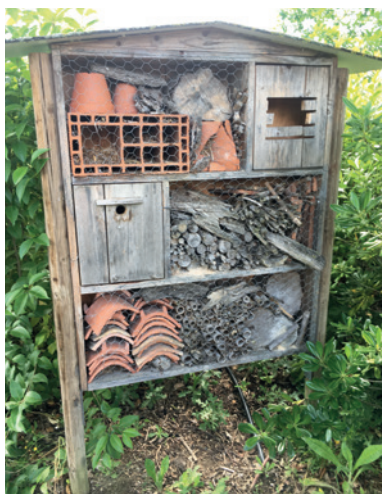
L'hôtel à insectes de Plaisance