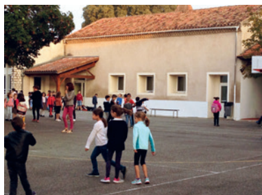
Des écoles équipées et entretenues