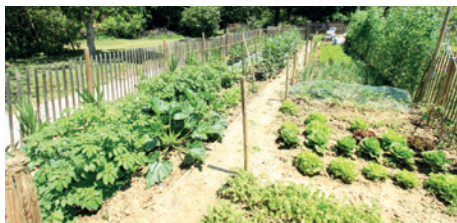
Beau succès pour les jardins familiaux

2008 2009 2010 2011 2012 2013 2014 2015 2016 2017 2018