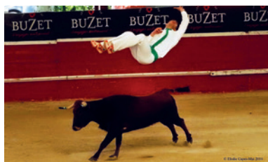
La course landaise, tradition taurine à Nérac