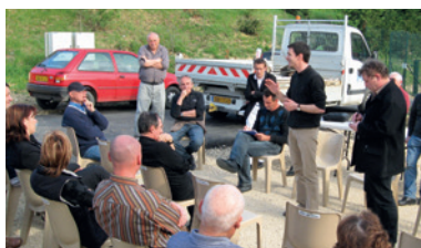
Une des 70 réunions de quartier