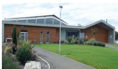
Piscine couverte, un succès populaire