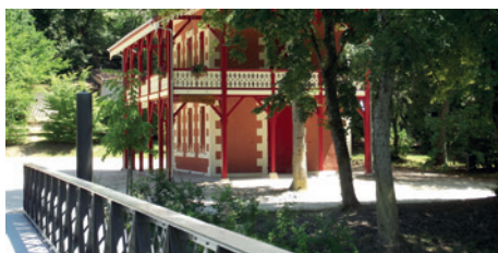
La passerelle neuve et le Chalet rénové