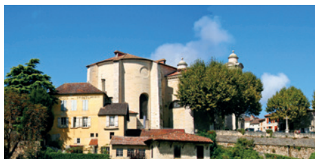
Un patrimoine objet de toutes les attentions