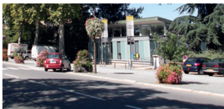
Le Parking de la médiathèque goudronné en 2011