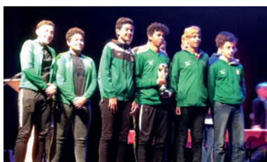
Soirée de récompenses des sportifs néracais