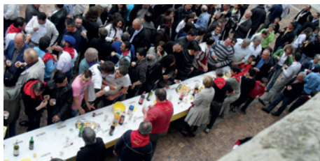
Succès populaire pour l'ouverture des fêtes de Nérac