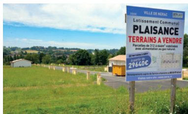
Lotissement Plaisance : devenez propriétaire !