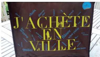
Accompagner le dynamisme de notre commerce et de notre artisanat