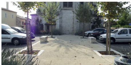
Aménagement de la Place Saint-Marc