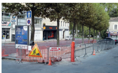
Aménagement de la Place Yves Bétuing en 2013