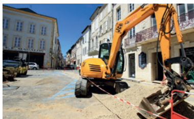
17 rues avec des canalisations neuves