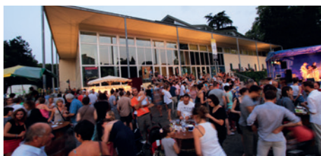
Le plaisir de se retrouver au marché « Mardi So Gascogne » depuis 2008