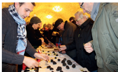
Le charme du marché aux truffes en janvier