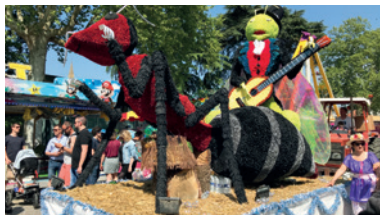
Fêtes de mai : une tradition néracaise