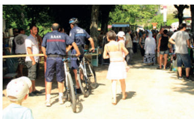
La police municipale à vélo pour plus de proximité