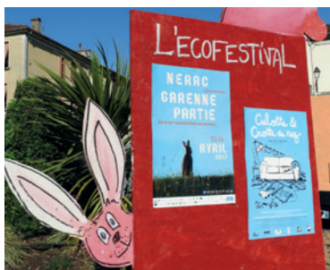
La Garenne Partie : le festival néracais